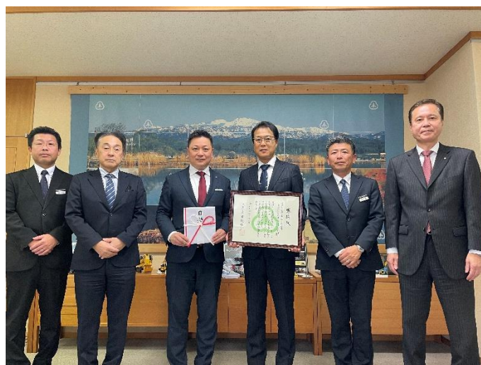
小松市役所にて寄附贈呈式が開催されました。

ホンダカーズ石川さまは、地球環境の保全を最重要課題のひとつと捉え、自動車の販売・整備を通じて人の健康の維持と地球環境の保全に積極的に努め、お客さまや地域社会に喜ばれるグリーンディーラーを目指しています。また、CO 2 排出量前年度比 6%削減を目標に掲げ、環境保全活動を実施しています。