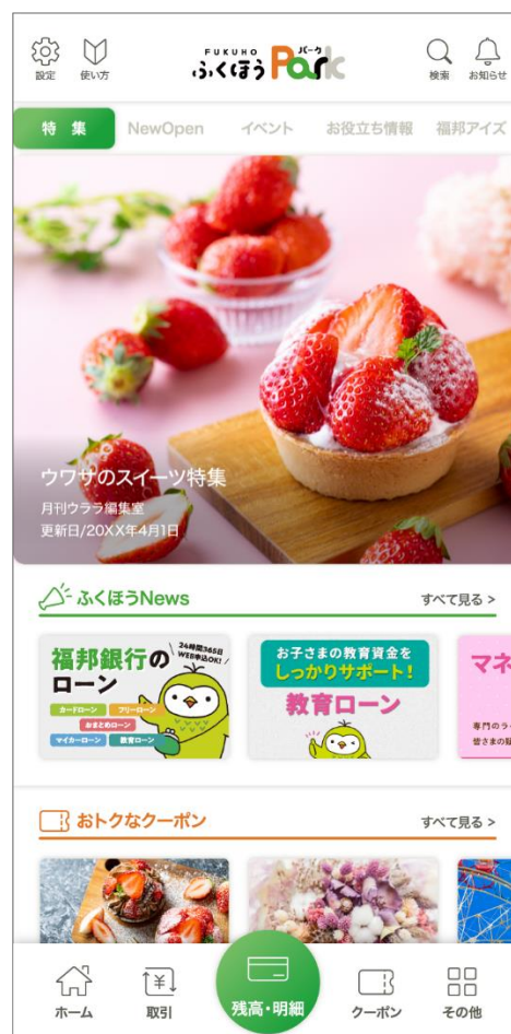
<トップ画面イメージ>

普通預金に加え、貯蓄預金、定期預金（証書式・積立式を除く）、カードローンの残高・明細照会が可能となります。また、明細を PDF または CSV ファイルでダウンロード（出力）することができます。