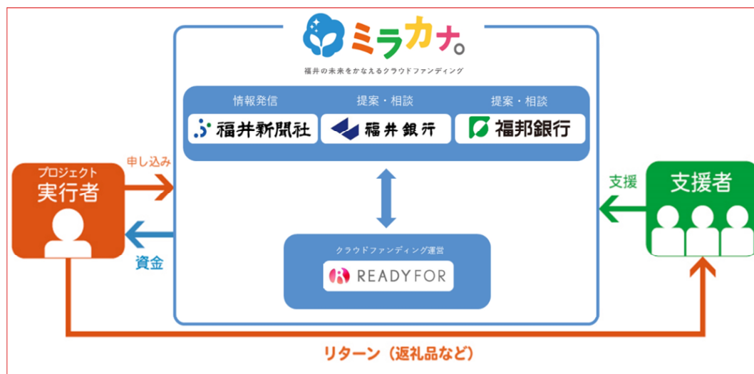
図：「ミラカナ。」枠組みのイメージ

今後は、福井銀行、福邦銀行、福井新聞社の三社と READYFOR が連携し、福井県内で事業を行う方々へ「ミラカナ。」という場を提供し、想いの実現のご支援を積極的に行ってまいります。また、新たな枠組みとなって初めての共同事業として、クラウドファンディングの活用と成功につなげるための「ミラカナ。」セミナーをオンラインにて実施いたしますので、合わせてお知らせいたします。