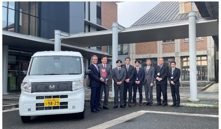
高島市役所にて寄附贈呈式が開催されました。

滋賀ホンダ販売株式会社さまは1956年に滋賀県初のホンダ四輪販売店として設立、65年以上に渡り大津市・草津市・高島市（湖西・湖南）・野洲市・守山市エリアでお客様に最適な安心・安全なカーライフを提案しています。全国13,000名以上が参加するホンダ四輪サービス技術コンクールでは、全国準優勝、近畿地区では優勝の実績もあり、お客様にご安心いただけるアットホームなサービスとサポートの提供に取り組んでいます。