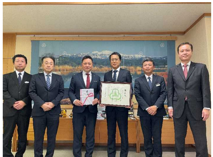
小松市役所にて寄附贈呈式が開催されました。

ホンダカーズ石川さまは、地球環境の保全を最重要課題のひとつと捉え、自動車の販売・整備を通じて人の健康の維持と地球環境の保全に積極的に努め、お客さまや地域社会に喜ばれるグリーンディーラーを目指しています。また、CO 2 排出量前年度比 6%削減を目標に掲げ、環境保全活動を実施しています。