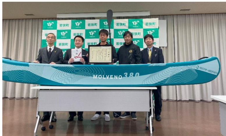
若狭町役場にて寄附贈呈式が開催されました。

大谷造船工業株式会社さまは明治35年創業、FRP（繊維強化プラスチック）船舶制作、国産艇・外艇の販売、修理、マリーナ運営などを行っています。2021年には夜間の安い深夜電力で充電、ソーラーパネルの電力も活用できる電池推進船建造工事に取り組み、満タン充電の巡行で約4～5時間航行を可能にするなど環境にやさしい船舶づくりにも力を入れています。運営するマリーナではメンテナンスの行き届いたクラブ艇をレンタルしており、県内外から多くのお客さまに利用されています。