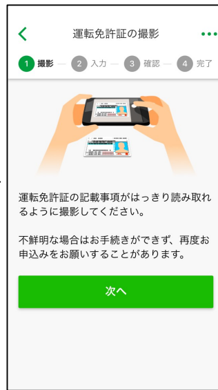
運転免許証の撮影